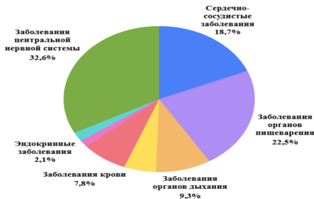
Рис. 4. Доля пациентов с соматоневрологической патологией (%), 2025 г