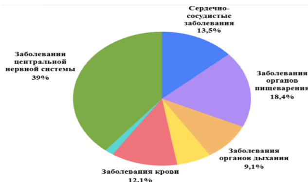
Рис. 3. Доля пациентов с соматоневрологической патологией (%), 2024 г

F10.52 — Психотическое расстройство, вызванное алкоголем: галлюциноз